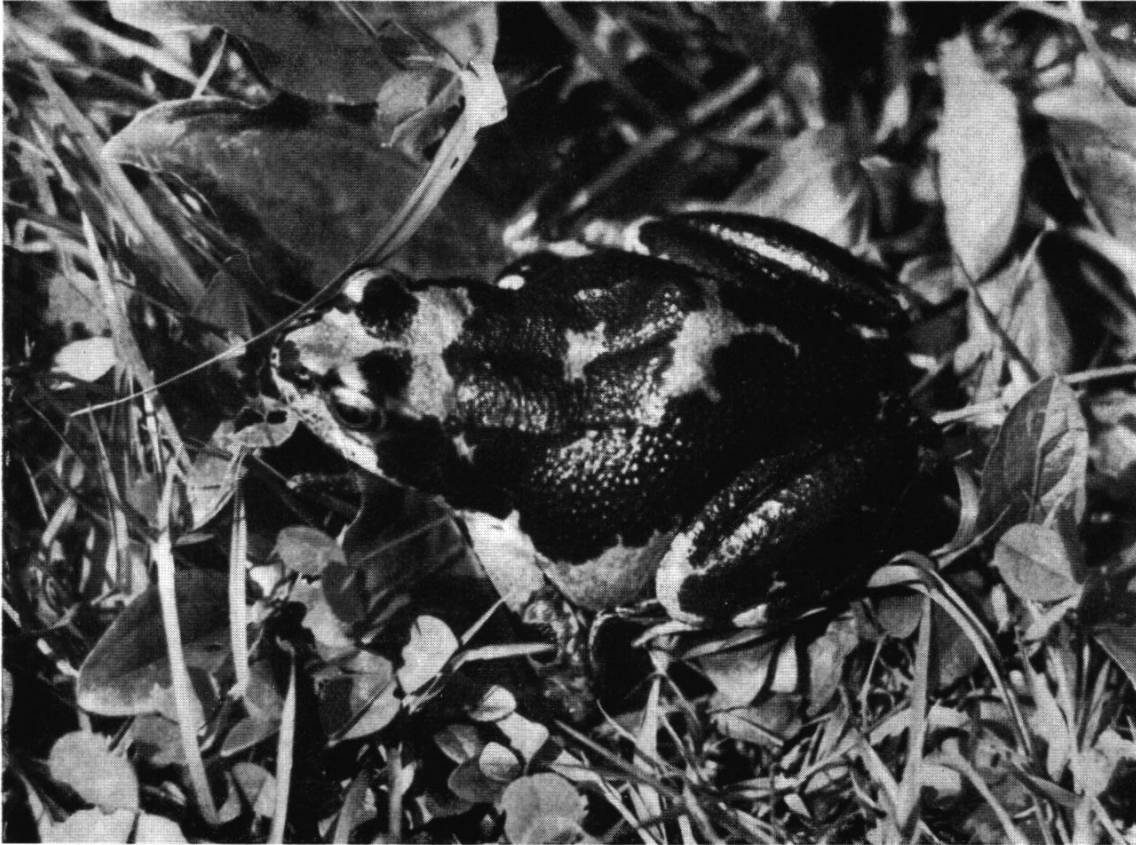
Abb. 3. Grasfroschschwärzling. Dieses außergewöhnliche Exemplar ist im August 1952 auf dem Wannenhof, Unterkulm, gefangen worden.