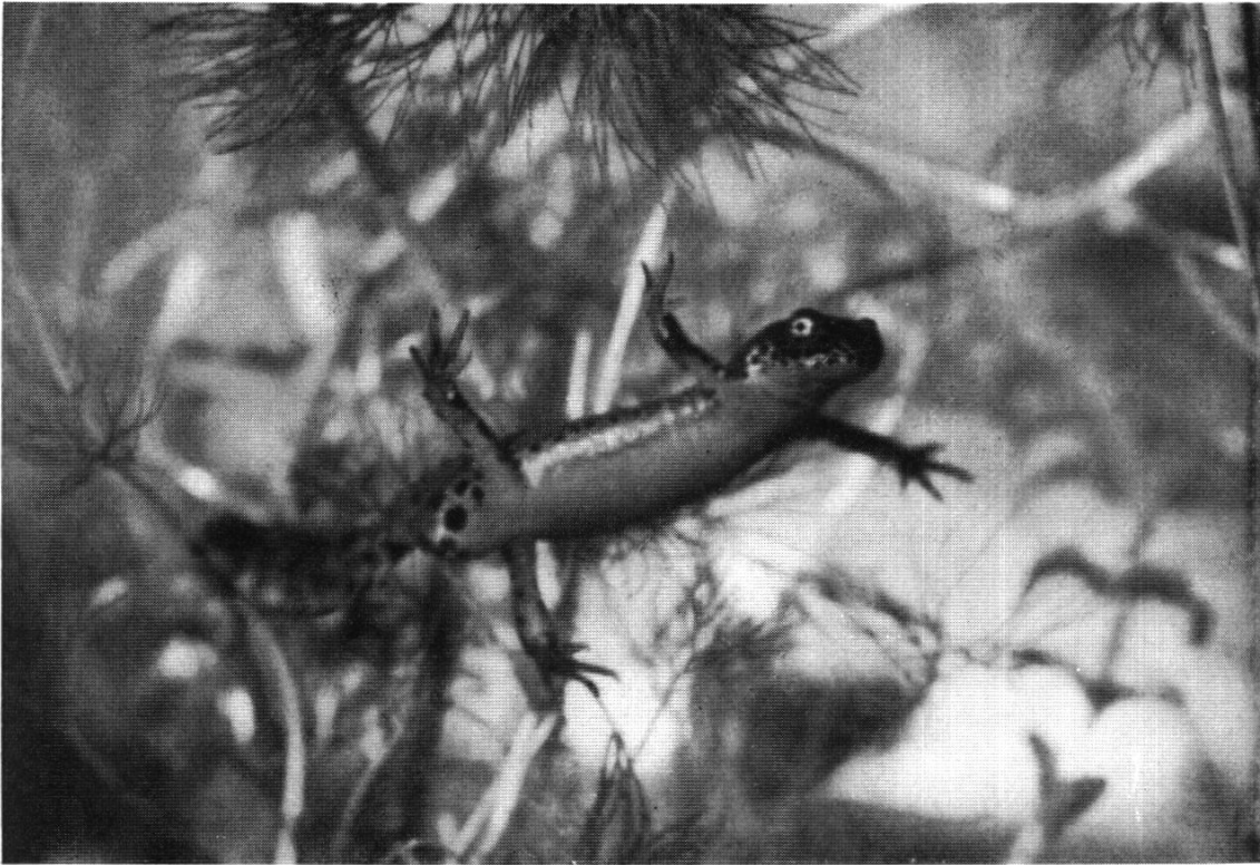
Abb. 1. Bergmolch (Männchen). Dieser farbenprächtige Molch bevölkert schon ab Mitte März in großer Zahl auch die kleinsten Tümpel und Gräben.