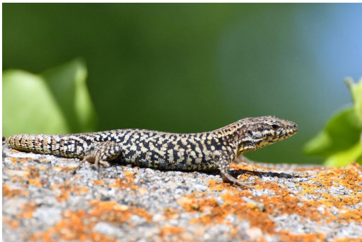
Figure 52 : Lézard des murailles

Lézard des murailles – Podarcis muralis (Laurenti, 1768)